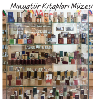
Minyatür Kitapları Müzesi