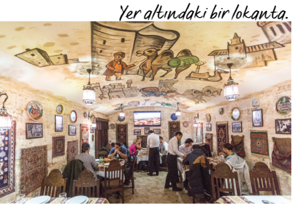
Yer altındaki bir lokanta.