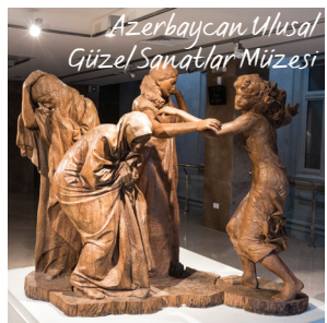
Azerbaycan Ulusal Güzel Sanatlar Müzesi