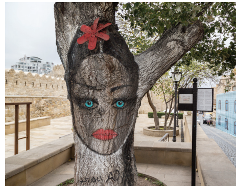
Ünlü ressam Ali Şamşi başta ölü olan bu ağacı sanat eseri haline getiriyor. Derken insanlar onu seviyor, önünde resim çektiriyor ve ağaç can buluyor! (@alishamsi)