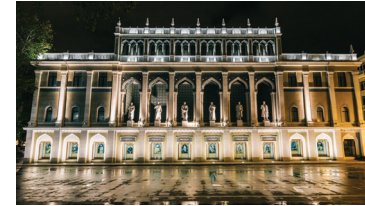
Azerbaycan Edebiyatı Müzesi