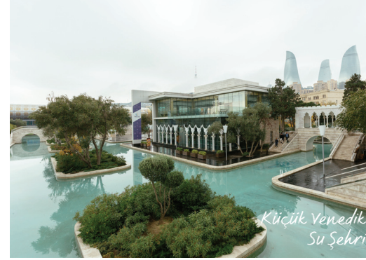
Küçük Venedik Su Şehri

■ BAKÜ DAĞÜSTÜ PARKI/ŞEHİTLER HİYABANI: 1918'deki Bakü Muharebesi'nde öldürülmüş Azerbaycan Türk'ü ve Türkiye Türk'ü askerlerin de defnedildiği yer.