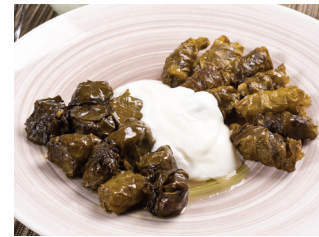
30'dan çok dolma ve sarma, 200'den fazla pilav çeşitleri var.

Bol bol yeşillikle karşılaşmaya hazır olun. Kendisiyle yıldırım barışık değildir ama hemen hemen her yemekte, salatada kişniş var. Yanı sıra nane, dereotu, fesleğen, maydanoz,