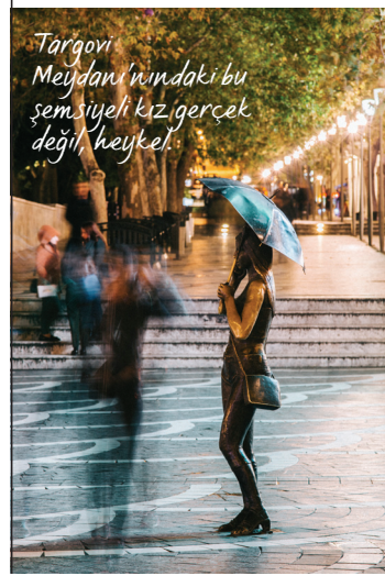
Targovi Meydanı'ndaki bu şemsiyeli kız gerçek değil, heykel!